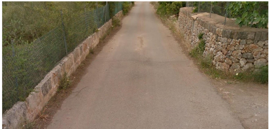
Vista general del camino