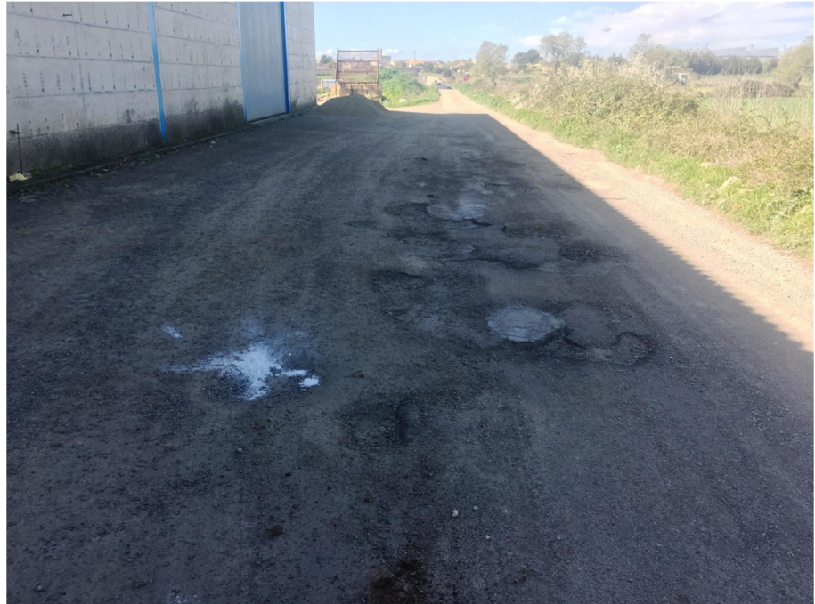
Primer tramo considerado